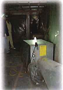
隔離養生区画内(除去作業前)